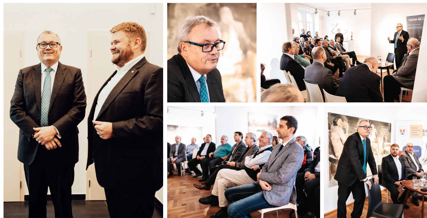
Listopad 2019 Inspirativní debata s Vladimírem Dlouhým